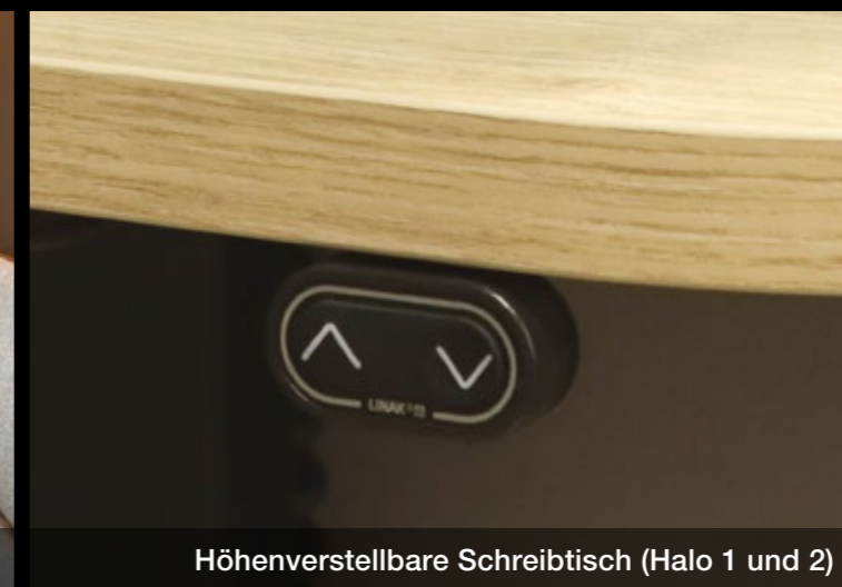
Höhenverstellbare Schreibtisch (Halo 1 und 2)