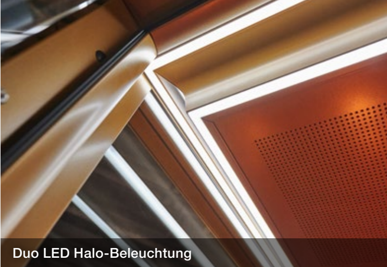
Duo LED Halo-Beleuchtung